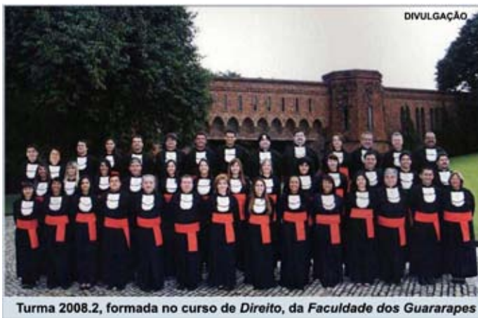
Turma 2008.2, formada no curso de Direito, da Faculdade dos Guararapes

o setor em palestras, congressos, inclusive, participou de uma missão no Irã, em 1991, visando um intercâmbio sobre o assunto. Pautado pelo senso de justiça social e o compromisso com o próximo, faltava-lhe ainda outro ofício para se sentir realizado. E, com a coragem e a humildade dos sábios, retornou aos estudos, formando-se em Direito, na turma 2008.2, cujo nome reflete o ideal de vida desse eterno guerreiro: “Chega-te aos bons e serás um deles”.