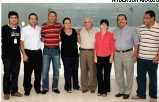
Equipe colaboradora das Eleições 2008