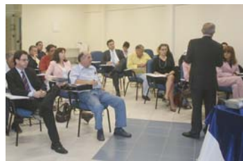
REUNIÃO – Explicação do ABN AMRO REAL.

de uma reorganização dos programas previdenciários do Grupo ABN AMRO no Brasil, já que é o único benefício não equalizado.