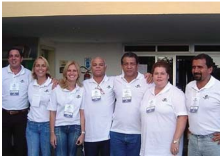
NOVA COORDENAÇÃO – Um dos destaques deste ano é a equipe organizadora do evento, que foi composta por funcionários da própria Bandeprev.

Criado com o propósito de informar, esclarecer, aproximar, estimular a auto-estima, os Encontros Regionais de Participantes da Bandeprev mais uma vez estão cumprindo a sua missão. Às margens do São Francisco; com a presença de cerca de 50 integrantes da entidade; e em clima de total amizade, transparência e descontração. Foi assim a estréia da sua sexta etapa. O primeiro de uma