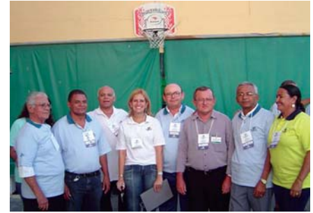
ATIVIDADES LÚDICAS – Os presentes ficam livres para decidir se participam. Em Petrolina, ninguém quis perder este momento, que foi repleto de descontração.

Os encontros seguem rumo a Caruaru e ao Recife. Até o fechamento desta edição do jornal, estava definida a programação da mencionada cidade do agreste pernambucano, para o próximo dia 25 deste mês. Serão contemplados os partici-