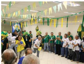
CORRIDA DA BEXIGA – Participantes mostram sua força numa prova bem disputada e cheia de catimbas.

podemos conferir no Relatório de Atividades, os mesmos foram positivos em todos os aspectos, previdenciais, financeiros e administrativos. Constatamos, por exemplo, um crescimento patrimonial de 7,97%, com relação ao ano anterior. Nos investimentos, mais uma vez, nossa rentabilidade consolidada superou a meta atuarial. Foi 14,67% contra 11,35%. Diante disso, fechamos o exercício registrando um superávit total de mais de R$ 181 milhões”, declarou, abrindo espaço às perguntas.